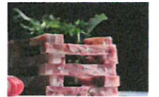
“张果老”是怎么成为肴肉的代言人的？