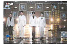
这四个小伙向世界歌唱吴江