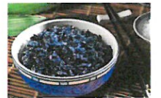
中午吃啥？来碗句容香喷喷的乌米饭！