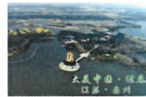
大美泰州诗意画卷在CCTV1打开