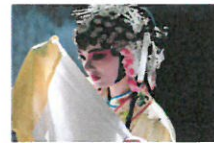
人文纪录片《昆曲六百年》